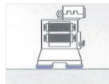
Klima- und Lüftungsgeräte